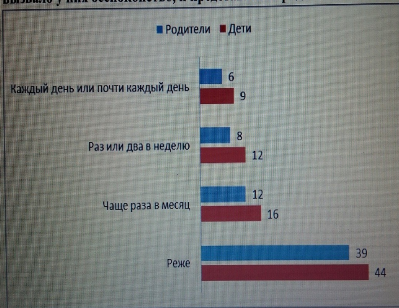
Рисунок 43. Частота столкновения детей с чем-либо негативным в интернете, что вызвало у них беспокойство, и представление родителей об этом

Вопрос 111: «Если ты ответил «да», как часто за последние 12 месяцев тебе доводилось видеть в интернете