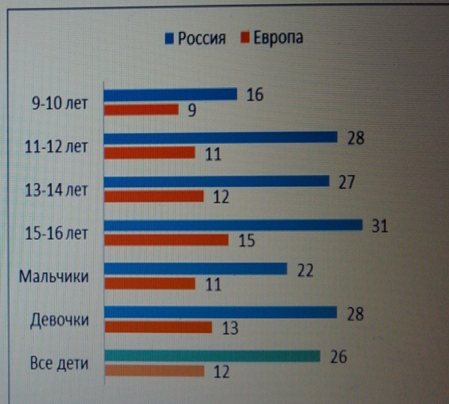
Рисунок 39. Я был обеспокоен из-за чего-либо в интернете, %

Вопрос 110: «Приходилось ли тебе в течение последних 12 месяцев видеть в интернете или переживать в связи с использованием интернетом что-либо такое, что каким-то образом обеспокоило тебя? Ты, например, почувствовал(а) себя неловко»