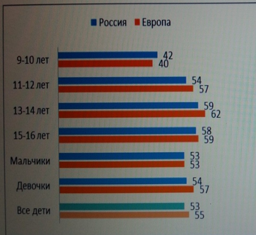
Рисунок 38. В интернете есть что-либо плохое для человека примерно моего возраста, %

Вопрос 322: «Как ты думаешь, есть ли в интернете что-либо плохое для человека примерно твоего возраста?»