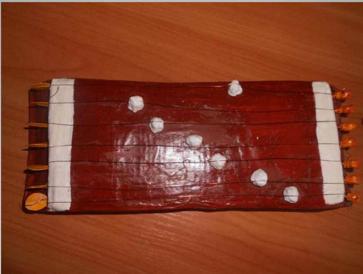
Чатхан папье – маше, Колосова Т.П.