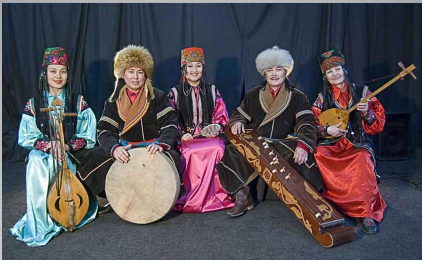
Фольклорный ансамбль «Айланыс» Республика Хакасия