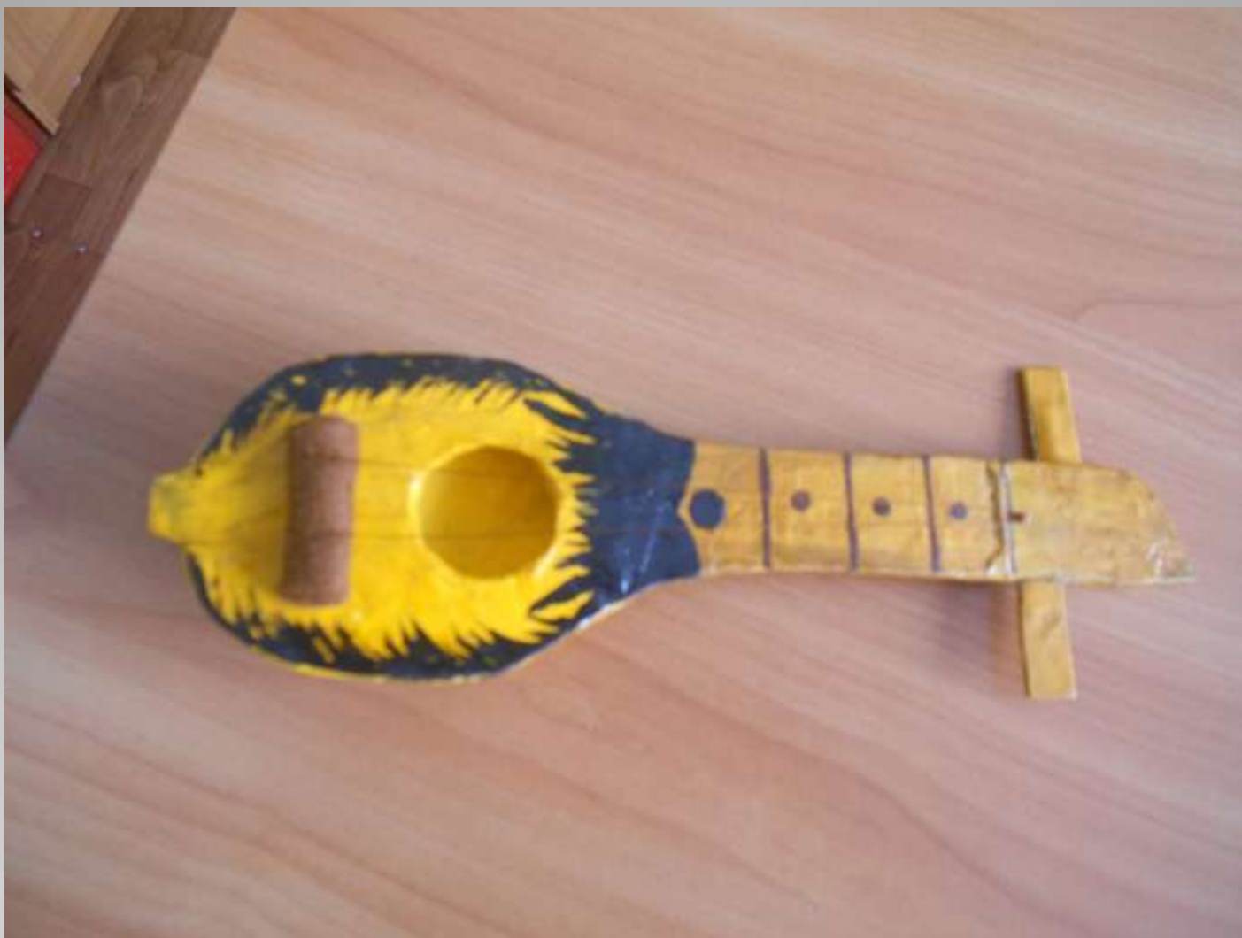
Хомыс, папье маше выполнила Колосова Т.П.