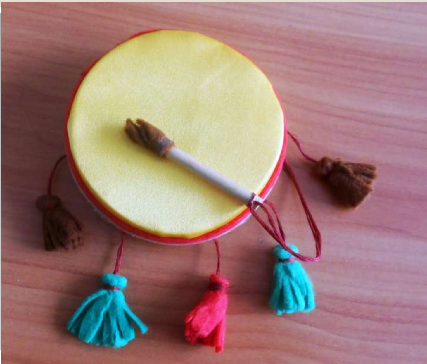
Бубен выполнила Колосова Т.П.